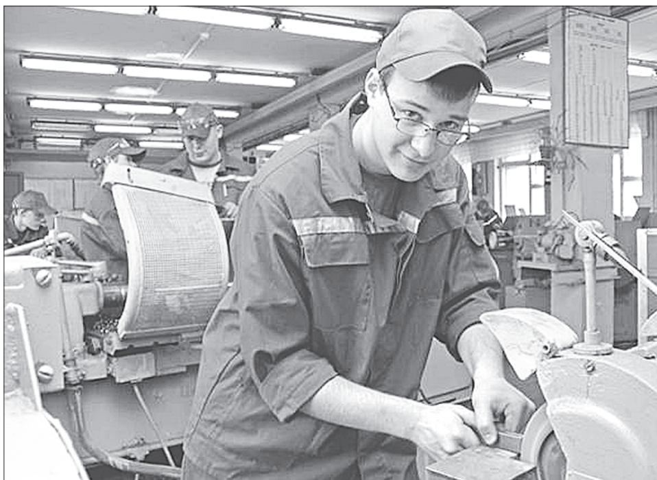
Лучше быть хорошим токарем, чем плохим руководителем

К слову сказать, многое зависит от работодателя. Те, кто ценят своих специ-