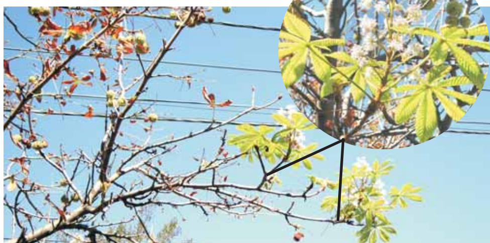
Читатели сообщают: по ул. Советская, в районе перекрестка с пер. Комиссаровский, в сентябре расцвели каштаны.