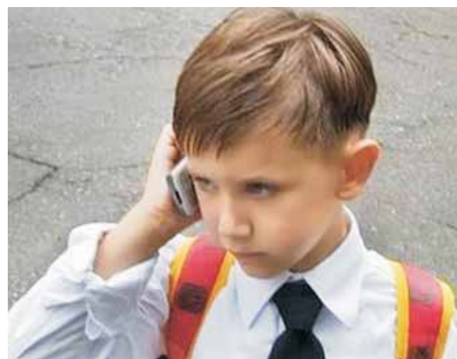
Имея телефон, ребенок сам может быстро попросить о помощи тех, кому он доверяет больше всего.

вычным, доступным средством связи и во многом необходимым. Так как с его помощью, имея номера телефонов родителей, бабушек и дедушек, учитель может быстро связаться с семьей, сообщить о сложившейся неординарной ситуации и вместе с близкими ребенка принять необходимые меры. Имея телефон, ребенок сам может быстро попросить о помощи тех, кому он доверяет больше всего, возможно, что и учителя тоже. В этом конкретном случае предлагаем учителю и родителям встретиться, объяснить друг другу сложившуюся ситуацию, и если у семьи нет возможности приобрести телефон, то обговорить иные формы экстренной связи между учителем и родителями, например, дать учителю номер мобильного телефона родителей.