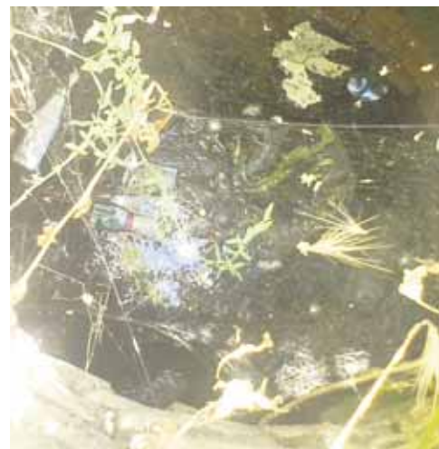
Три года жители пер. Новый поддерживали колодец в порядке, пока его не залило водой.

- Работы по чистке колодца от грязи и мусора выполнены, произведено накрытие его крышкой.