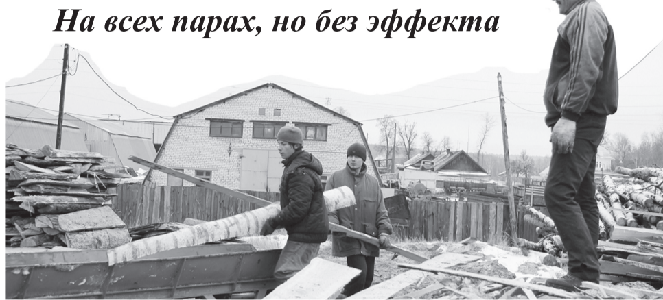
●Новодмитриевка. На устранение нарушений остался один день

В начале ноября на страницах нашей газеты была поднята проблема, касающаяся плохого отопления домов в Новодмитриевке. Ранее, напомним, там были установлены новые экономически выгодные котлы в котельной и теперь она работает на древесной щепе и опилках. «Работает»... на всех парах, но без эффекта.