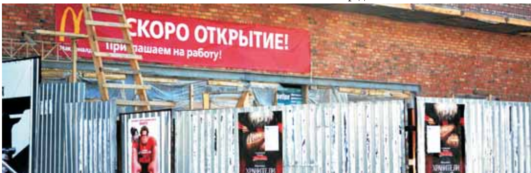
Строительство ресторана «Макдоналдс» на территории кинотеатра «Аврора».

- Да, проект действительно масштабный, но фактически мы уже начали его реализовывать, осуществляя строительство жилых домов в третьем микрорайоне поселка Артем, а уже в следующем году начнем и в пятом микрорайоне. Для тех, кому реализация такого проекта кажется уж очень фантастичной, могу сказать, что по сути дела «Олимпийский» - единственное «пятно», пригодное для масштабного жилого строительства. Конечно, можно было бы продолжать точечную застройку, выкраивая то в центре, то в поселке Текстильщиков в буквальном смысле «кусочки», вплотную расположенные к спортплощадкам школ или нависающие над уже имеющимся индивидуальным жильем. Но тогда скажите – где будет жить следующее поколение шахтинцев? Проект «Олимпийский» рассчитан не на три с половиной года и даже не на пять. По нашим расчетам, полностью построить новый район, включая дороги и объекты инфраструктуры, возможно в течение десяти – пятнадцати лет. Но кто должен начать. Мы готовы. Большой плюс реализации проекта «Олимпийский» в том, что помимо строительства самого жилья, он станет реальным сигналом инвесторам о перспективности вложения средств в город Шахты.