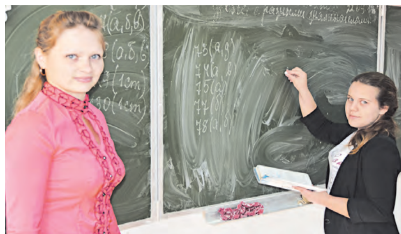
Урок математики в восьмом классе