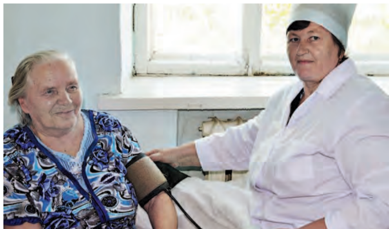
Для больных важны не только процедуры, но и внимание медсестры