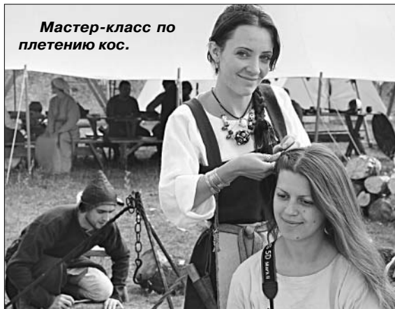
Мастер-класс по плетению кос.