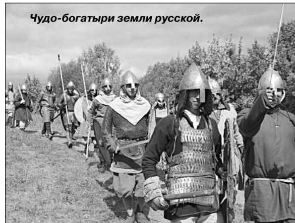
Чудо-богатыри земли русской.