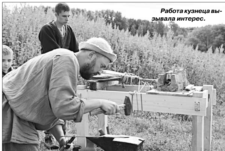
Работа кузнеца вызвала интерес.

умельцы. Народ с удовольствием покупал матрешки, деревянную посуду, плетеные корзины, луки и