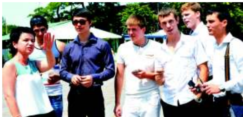
Студенты первыми опробовали сеть WI-FI.

Зону WI-FI шахтинцы ждали уже давно. Молодежь города обращалась с