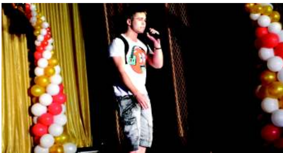
Каждый рэпер подготовил по три трека для выступления.

Фоторепортаж - на сайте shakhty-media.ru