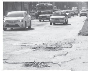
На углу Ленина и Кооперативной.

- Как стало очевидным, новые дороги довольно сносно переживали. Это участки проезжей части улиц Подлесной и Фрунзе. Кстати, дорога на Фрунзе уже вторую зиму без ям, за исключением тех, которые появились после проведения коммунальных работ. Это говорит о качестве нового покрытия и проведённой работы и указывает на необходимость капитального строительства. «Разгуляться» в этом направлении в последнее время стало трудно из-за сокращения краевых программ. Но как только представится такая возможность, в первую очередь, планируется покрыть новым асфальтом улицу Коммунистическую.