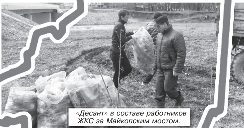
«Десант» в составе работников ЖКС за Майкопским мостом.

Работники городской администрации активно подключились к субботникам, которые проводятся в ходе месячника по наведению санитарного порядка. В минувшую субботу они произвели обрезку сухостоя по улице Комарова. На очередную уборку вышли чиновники и сегодня.