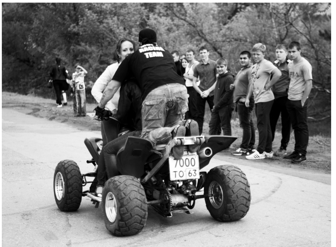
Экстремальное шоу от самарских квадрациклистов