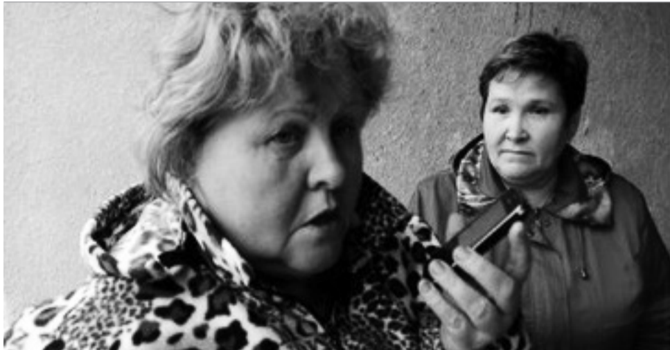
Жителям Подгорного приходится общаться с местными депутатами только по телефону