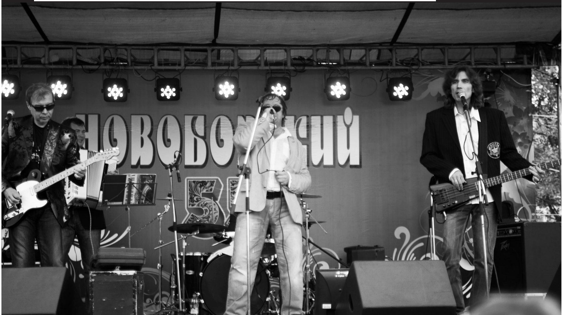
Уже ближе к вечеру 7 сентября на праздничной сцене появился «гвоздь» программы – московская группа «Рождество»