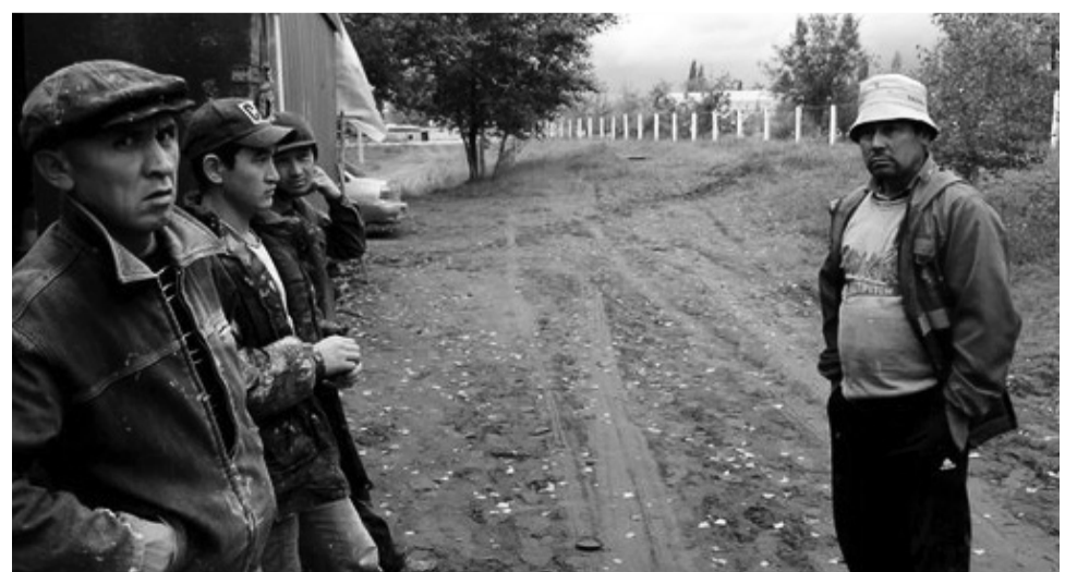
Граждане Киргизии работают в Борском без трудовых договоров