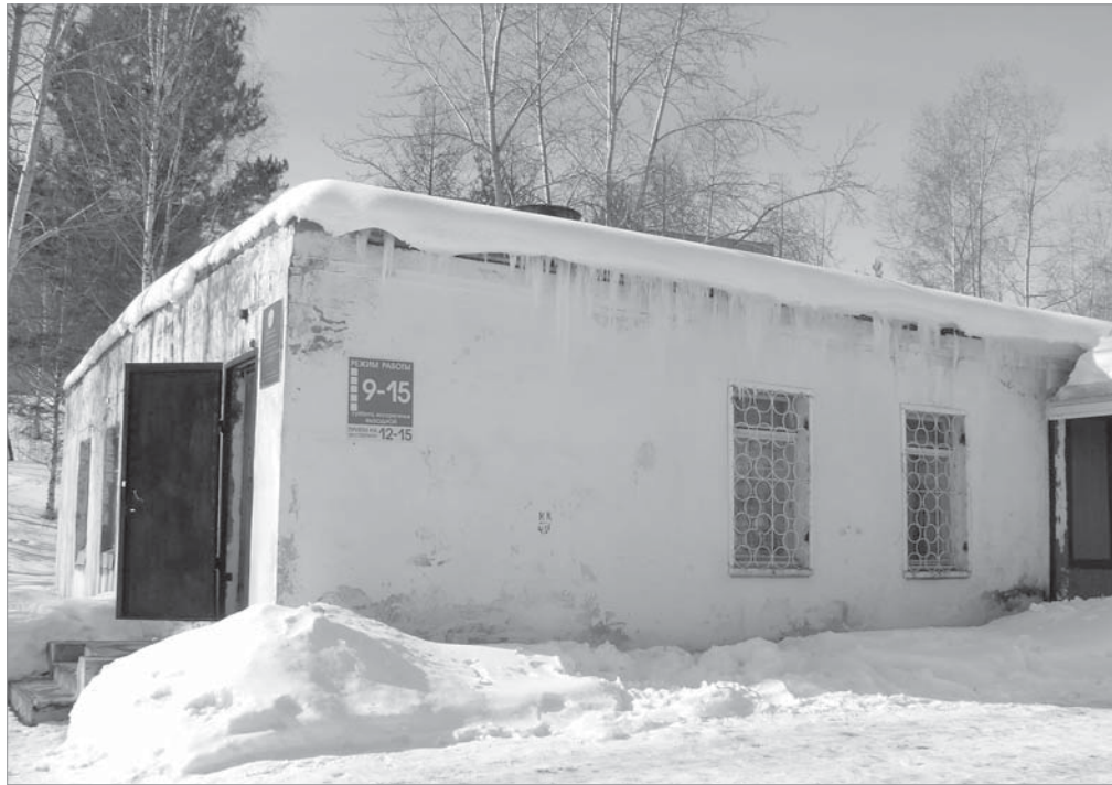
Ремонт здания судебно-медицинской экспертизы – не единственная проблема, которую нужно решить