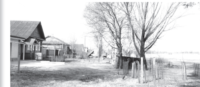
• Канализование улиц у Верхнего пруда – «больной» вопрос. Сколько стоков утекает в пруд?

Нерешённых «болеющих» вопросов охраны окружающей среды в Выксунском округе по-прежнему остаётся много. Но растёт и число обращений по вопросам экологии неравнодушных к будущему Земли наших земляков – об этом можно судить по количеству звонков и писем, поступивших в «ВР». Из наших маленьких усилий рождается мощная река противодействия бездумной, саморазрушительной деятельности человека. Сохранение жизни на Земле зависит, прежде всего, от каждого из нас. Лидия Козелова.