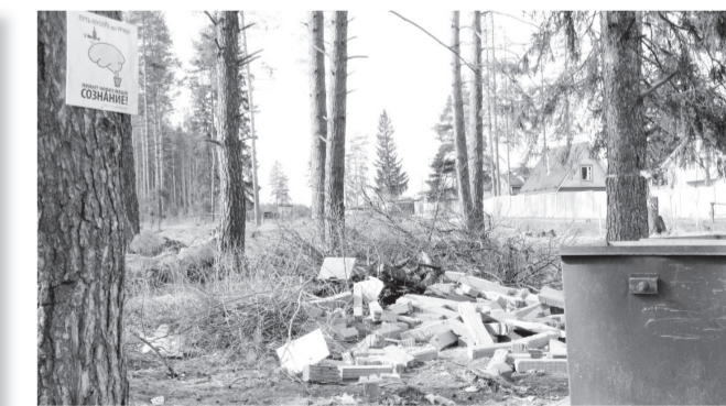
• Бери больше – кидай дальше от мусорных баков

Участвовали юные экологи из Досчатого и в викторине «Интернет-проект», где было заявлено 1000 команд, в том числе из Беларуси, Украины. Наши юные земляки заняли седьмое место.